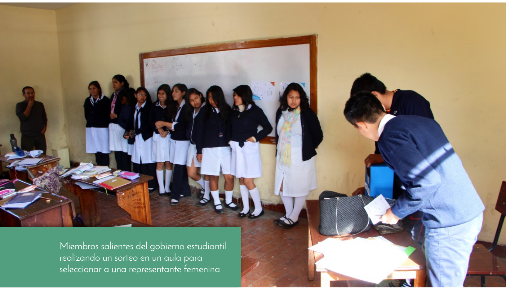
Miembros salientes del gobierno estudiantil realizando un sorteo en un aula para seleccionar a una representante femenina

Una vez que la escuela está generalmente de acuerdo con la participación rotativa de los estudiantes en el gobierno estudiantil, trabaje con los maestros y administradores para establecer las fechas, horas y ubicaciones de las elecciones para evitar conflictos de programación con otras partes del cronograma de la escuela. Trate de obtener la mayor cantidad posible de maestros y personal para comprometerse a estar presente y ayudar con las elecciones.